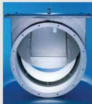
Valvola di non ritorno